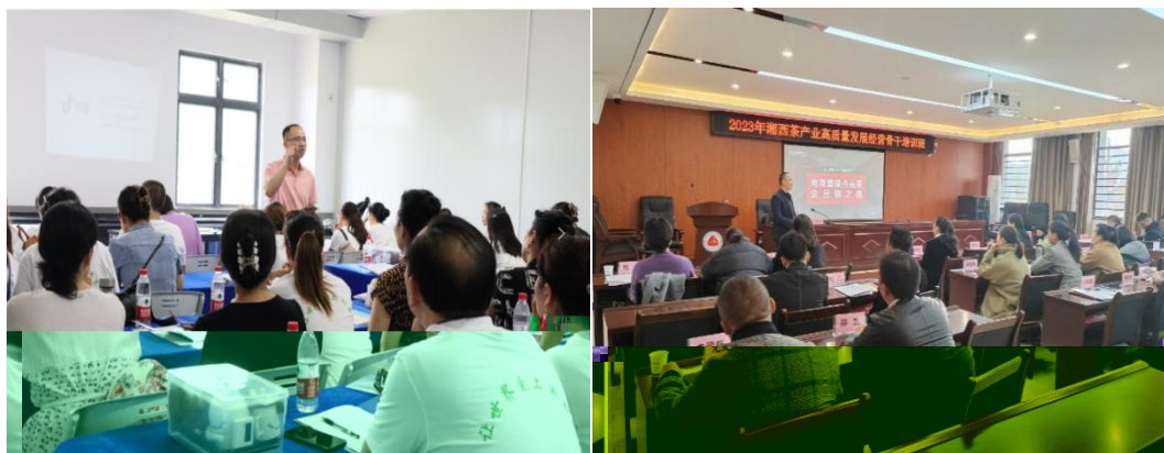
图 企业协助学校为湘西茶企开展电商直播培训

更 对 电 的 。 过 的 ， 茶 得 更 地 电 播的操 、 策 等方 的 ， 电 的 奠定 础。