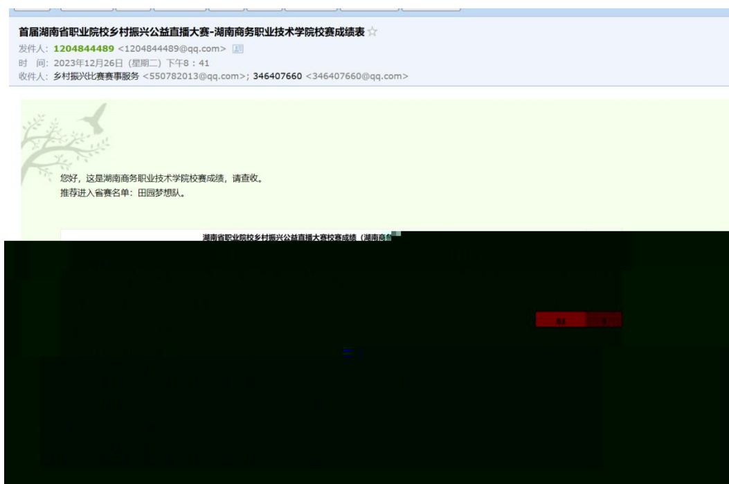
图 湖南商务职业技术学院学生在湖南省首届职业院校乡村振兴直播大赛中获得好成绩

的队。 成的得不 对 合 方的 ，更 对公 电 播 导和 操 的 充分 。 过 的 度合 ，公 不 供 的 播 和 ，更 比 搭 才 的 ， 、 供 。