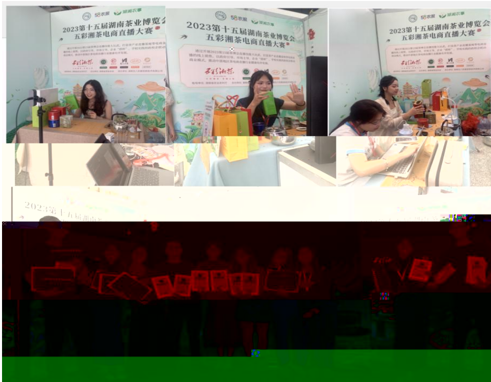
图 “湖南省第十五届茶博会” 电商直播比赛现场

播和方的，短 得的步。 队比 10多单、单， 包但不、等多个，的 和队得的高度。的 得不对公的，更对参 付出和的充分定。