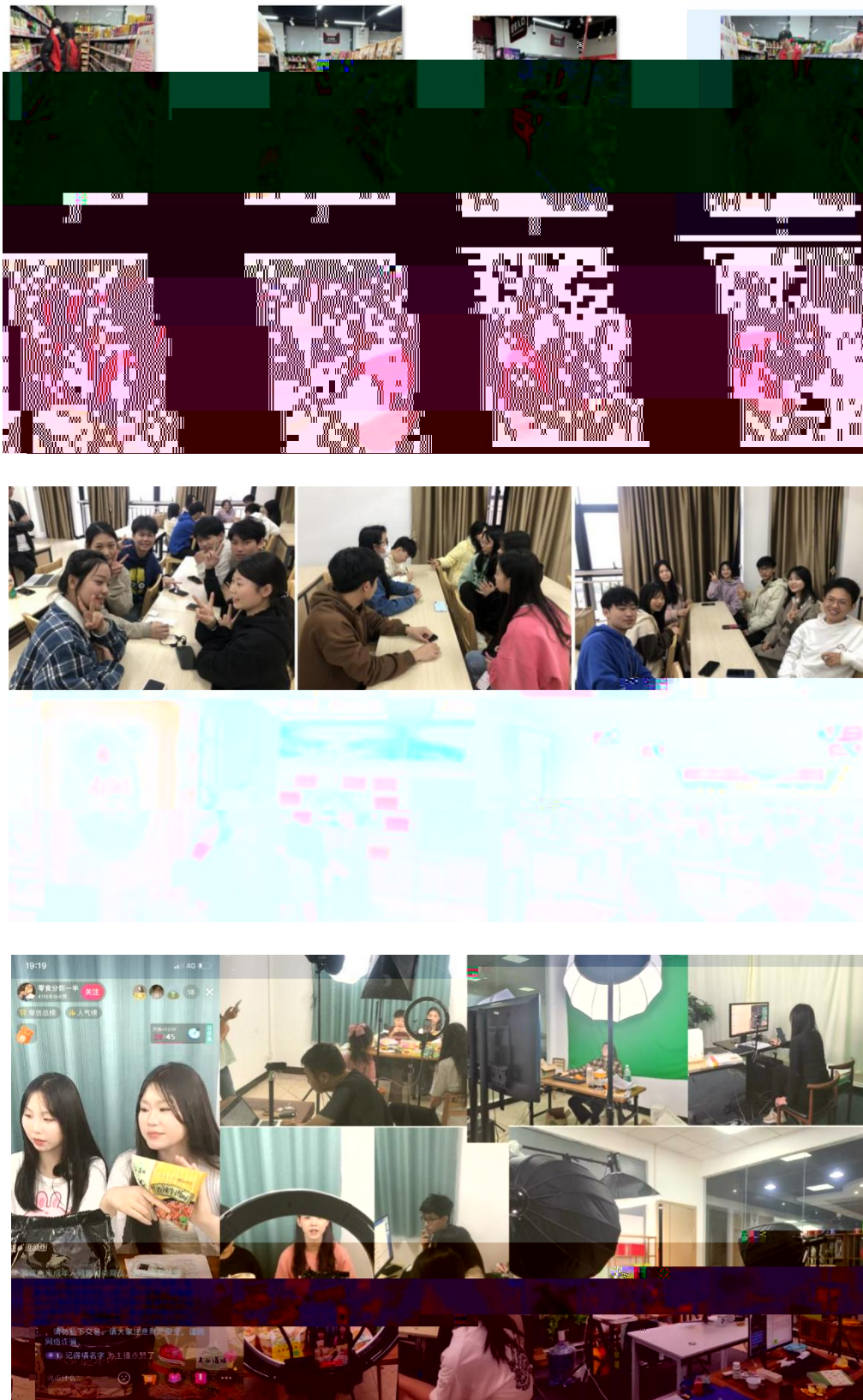
图 组织学生开展实习实训